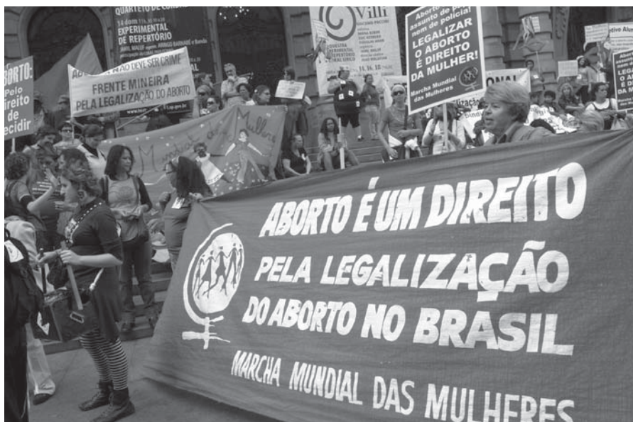
Faixas pela legalização do aborto coloriram o centro de São Paulo

O desafio é organizar um movimento amplo, popular e enraizado na sociedade