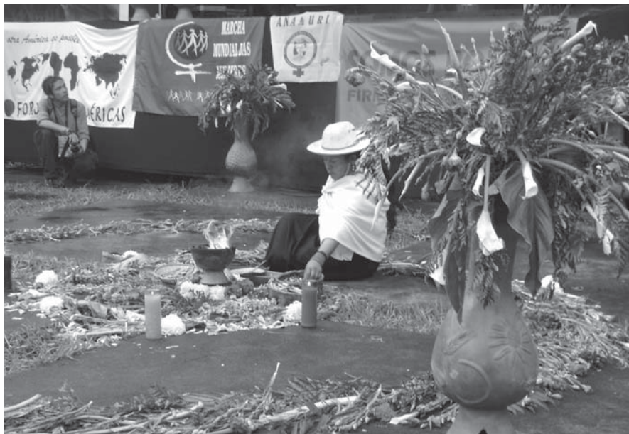
Presença indígena foi uma das marcas do Fórum Social Américas

rum, em conjunto com a REMTE, mulheres da Via Campesina, entre outros movimentos aliados, pontuaram a centralidade do feminismo para a construção de alternativas e para a soberania alimentar. Foi realizada uma oficina sobre as ações de 2010, que contou com um histórico da MMM e a apresentação dos campos de ação.