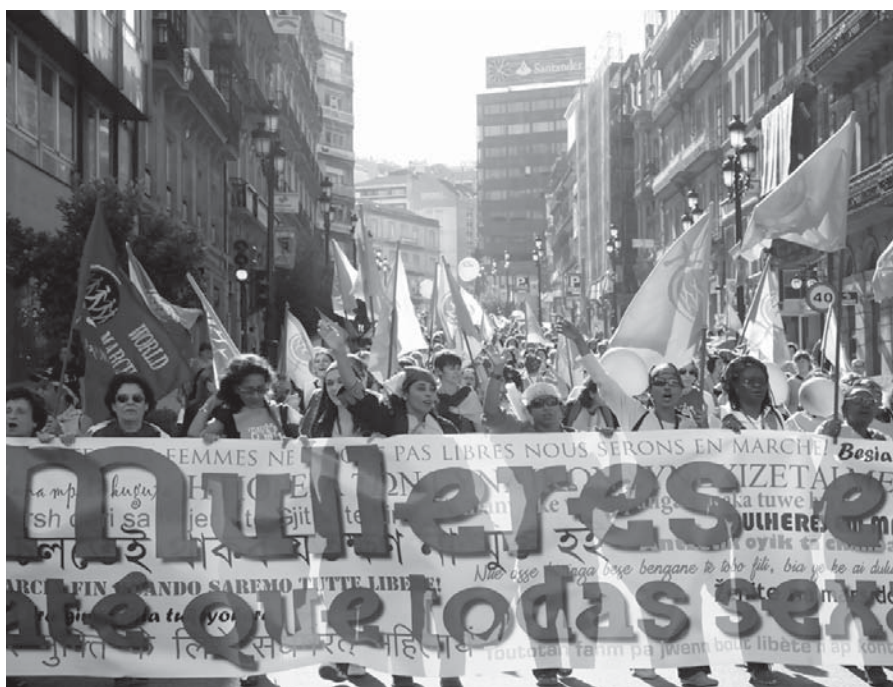
Manifestação tomou as ruas de Vigo, na Galícia, e demonstrou a solidariedade internacional das mulheres

O encontro avançou em um de seus principais objetivos: a definição das ações de 2010. O calendário se abrirá no 8 de março, marcando os 100 anos da declaração do dia internacional das mulheres. Serão realizadas marchas de mui-