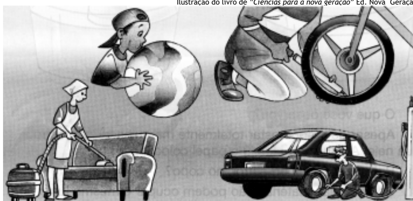
Mulher "aprendendo" sobre o ar.