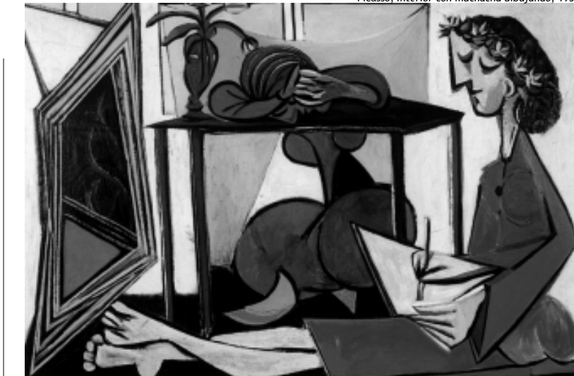
Picasso, Interior con muchacha dibujando , 1935