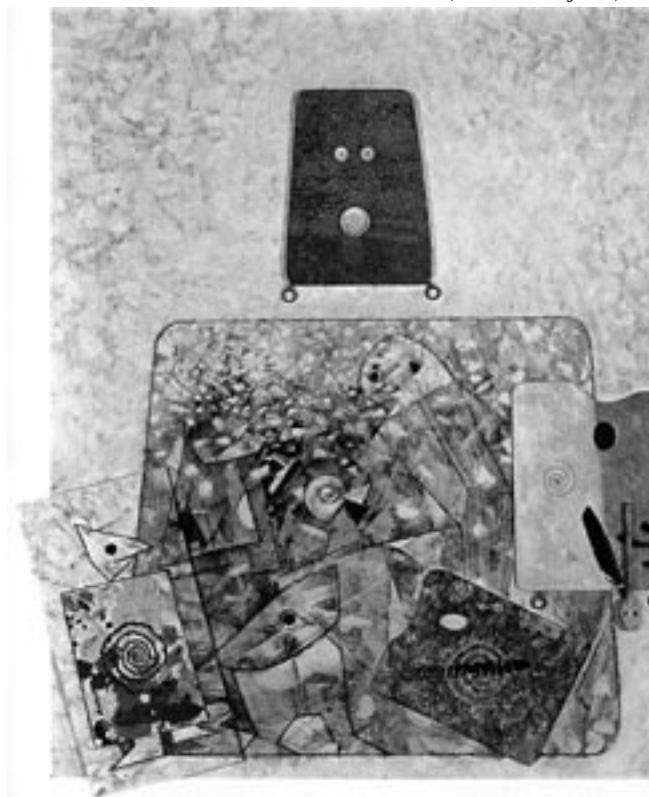
Max Ernst, Naissance d'une galaxie , 1969