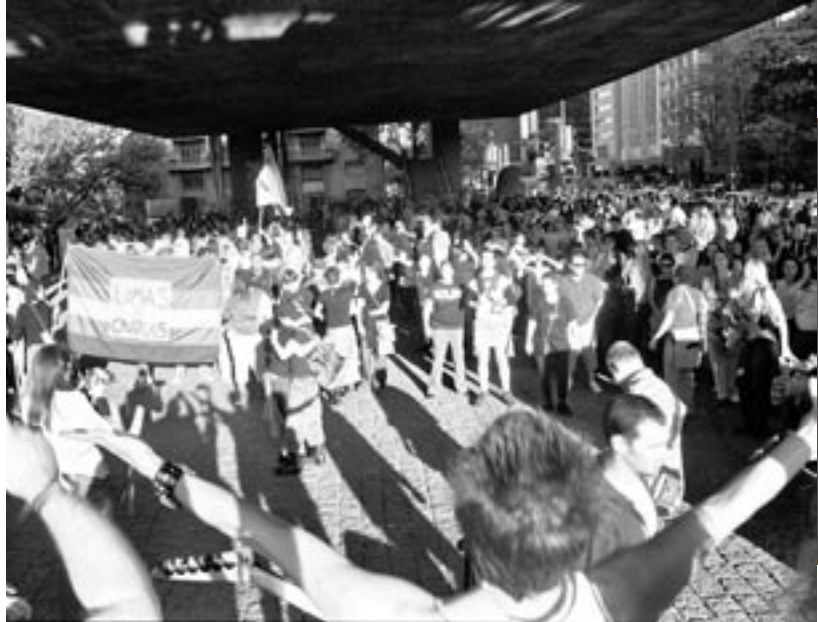
28 de maio de 2005: 3ª Caminhada das Lésbicas em São Paulo levou milhares para as ruas