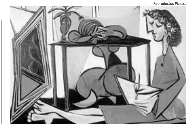
Reprodução / Picasso

A proposta é que as Coordenadorias mantenham um diálogo permanente com os grupos e movimento de mulheres