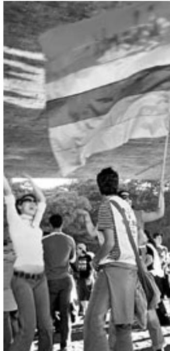
O capitalismo não entende que orgulho lésbico não combina com consumo de mercadorias

Me inquietam, por outro lado, tendências cada vez mais predominantes no seio dos movimentos LGBT do Norte, como a crescente afirmação de um poder dos consumidores que foi somado ao arsenal de estratégias jurídicas e políticas nas lutas por nossos direitos. Trata-se principalmente do poder dos homens gays de classe média e alta, cujo potencial de consumo é o mais elevado. Mas esta estratégia dá lugar a perigosos desvios sobre os quais não refletimos nem atuamos o suficiente. Nossa cultura é cada vez mais consumista. Quando assisti à inauguração da semana do orgulho gay em Nova Iorque, em 2004, recebi uma bandeira com o arco-íris e o logo da girlpriedestone.com, empresa que vende camisetas com slogans provocati-