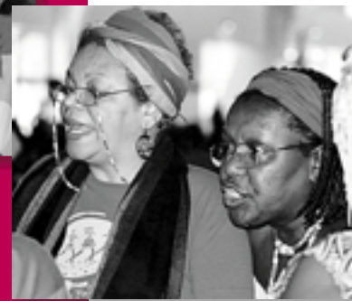
Em Brasília: diálogo e apresentação de propostas e prioridades para as mulheres