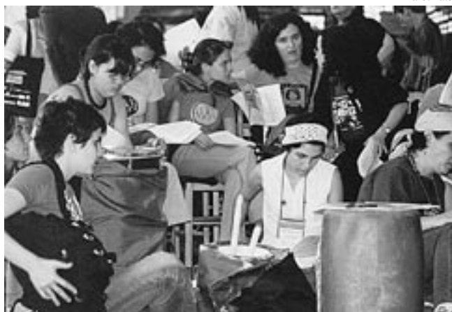
Conferência contou com a participação de diversos movimentos, entre eles a Marcha Mundial das Mulheres

Não permitiremos mais que as mulheres sejam vistas como instrumentos das políticas públicas, inscrevemos no olhar das políticas públicas de gênero uma visão crítica das políticas familistas e, mais importante, colocamos as mulheres organizadas como sujeito, capazes de dizer aos governos que nossas prioridades exigem uma mudança no modelo econômico que subordina o país, estabelecemos nossa prioridade de lutar pela recuperação do Salário Mínimo, que beneficiará a maioria das mulheres rurais e urbanas, debatemos a Alca e exigimos a inserção soberana do país nas negociações internacionais, mostrando que tudo isso interessa às mulheres e que não abriremos mão desse debate.