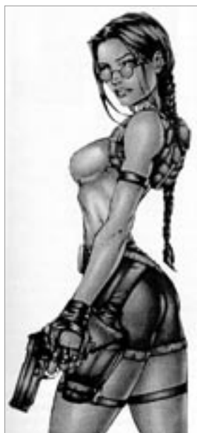
Ilustração de Lara Croft

Quando a publicidade junta o ideal de beleza com a fragmentação do corpo reifica este corpo e o coloca no mesmo