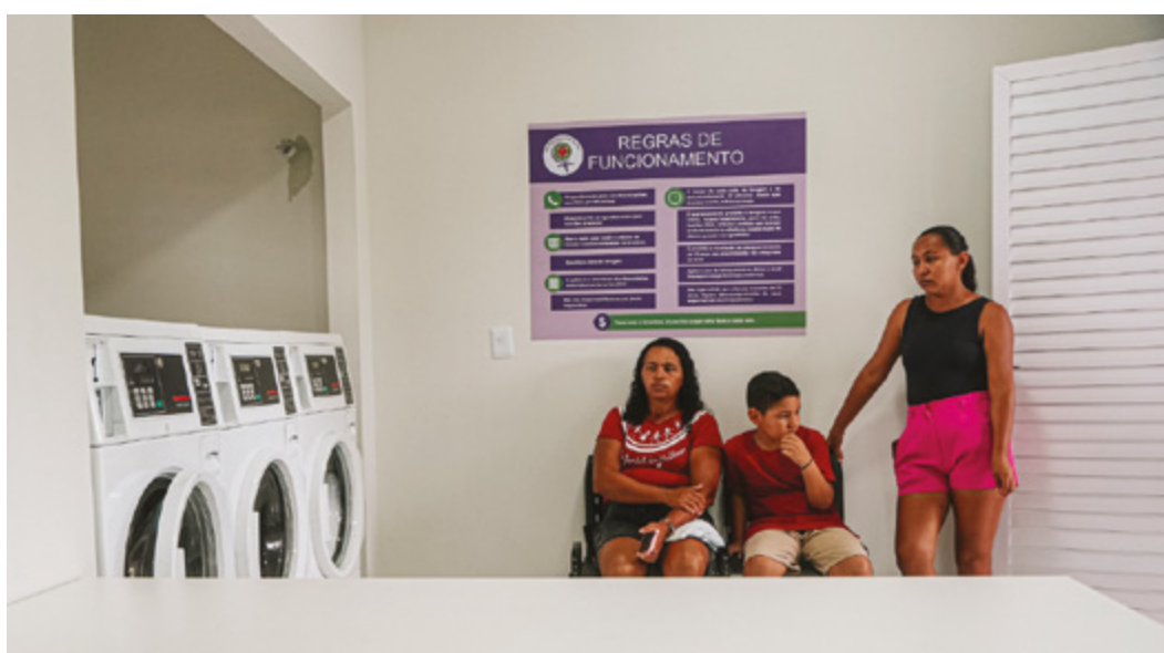
Lavanderia Coletiva e Agroecológica Nalu Faria, Assentamento Mulunguzinho, Mossoró (RN) - Centro Feminista 8 de Março. Fotos: Wigna Ribeiro